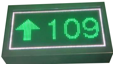
Ilustración. Ingecom sistemas se reserva el derecho de mejorar y actualizar la imagen del producto fabricado.